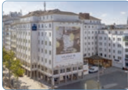
Best Western Hotel zur Post Standort: Bremen Anzahl Zimmer: 175