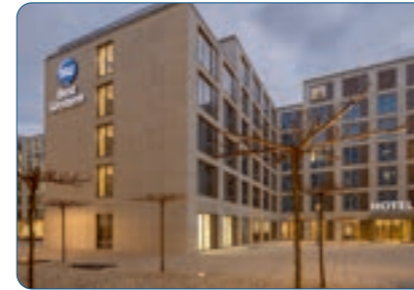
Best Western Hotel Wiesbaden Standort: Wiesbaden Anzahl Zimmer: 165