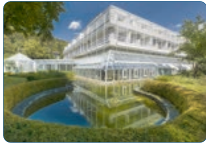
Best Western Premier Parkhotel Standort: Bad Mergentheim Anzahl Zimmer: 116