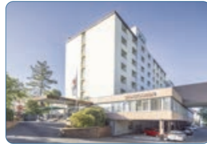
Best Western Plus Hotel Steinsgarten Standort: Gießen Anzahl Zimmer: 126