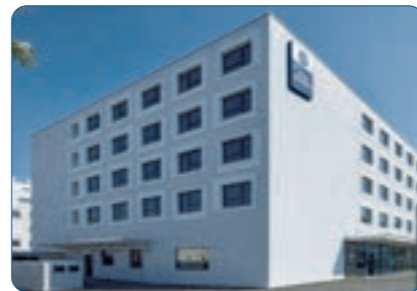
Best Western Hotel Tulln Standort: Tulln | Österreich Anzahl Zimmer: 78