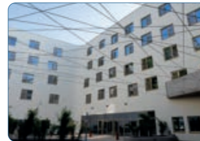
Best Western Hotel Spinnerei Linz Standort: Linz | Österreich Anzahl Zimmer: 115 Anzahl Apartments: 10