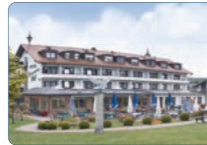
Best Western Hotel Brunnenhof Standort: Weibersbrunn Anzahl Zimmer: 52