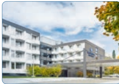
Best Western Hotel Kaiserslautern Standort: Kaiserslautern Anzahl Zimmer: 152