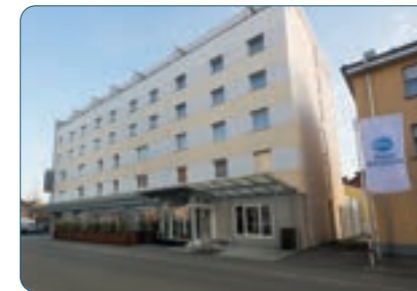
Best Western Hotel Lamm Standort: Singen Anzahl Zimmer: 76