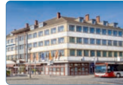
Best Western Hotel Hohenzollern Standort: Osnabrück Anzahl Zimmer: 107