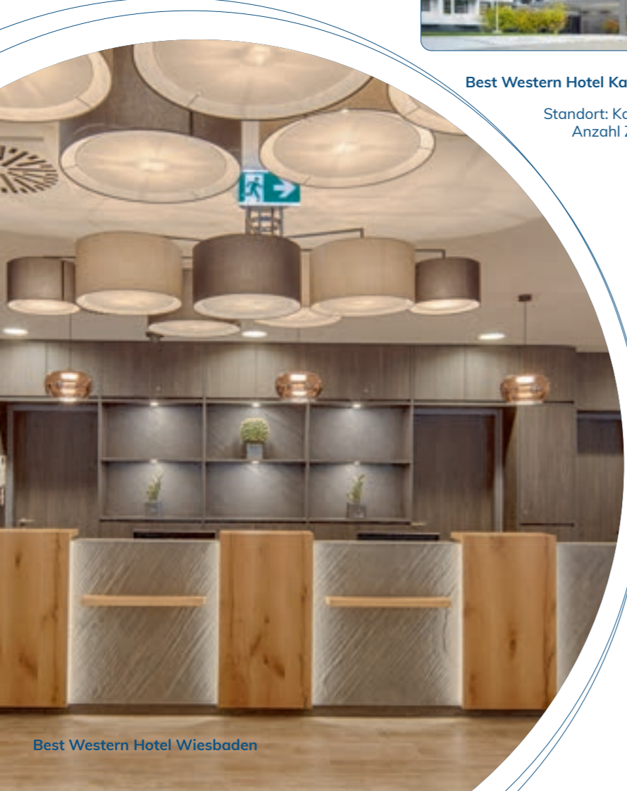
Best Western Hotel Wiesbaden