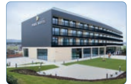
Best Western Premier Parkhotel Hagenberg Standort: Hagen in Mühlkreis | Österreich Anzahl Zimmer: 93